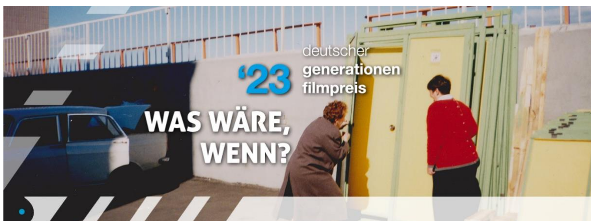
Deutscher Generationenfilmpreis, Visual zum Jahresthema 2023: WAS WÄRE, WENN?

Neben der Möglichkeit der freien Themenwahl werden auch im Deutschen Generationenfilmpreis jährlich wechselnde Jahresthemen ausgeschrieben, die sich auf die Interessen der Filmemacher*innen und auf gesellschaftspolitische Aspekte beziehen. 2023 lautete das Jahresthema „Was wäre, wenn?“ und rief damit zu Einreichungen auf, die fantasievoll neue Wege beschreiten und Gedankenspiele eröffnen.