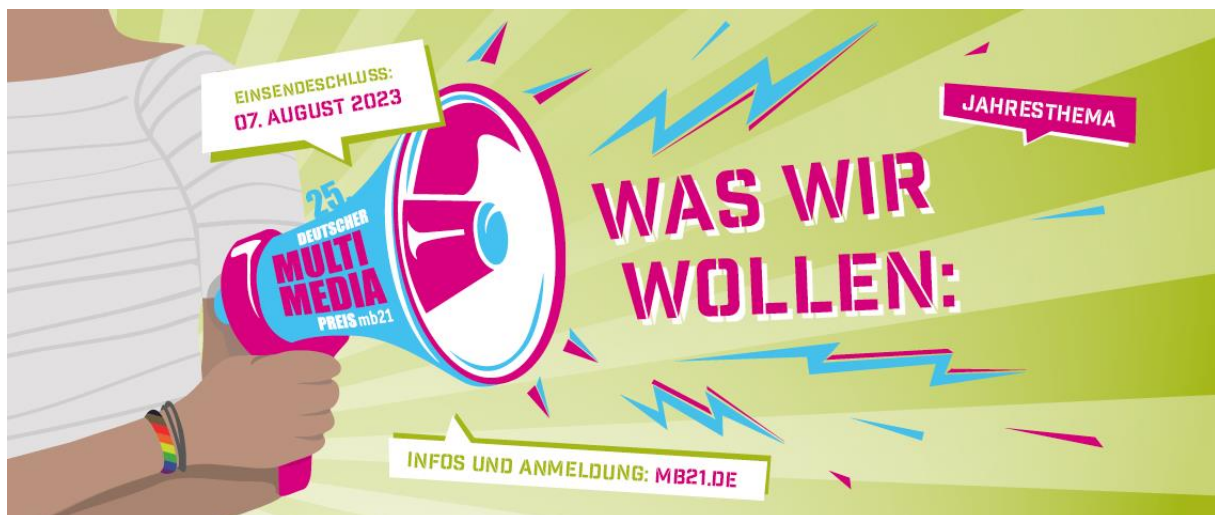
Deutscher Multimediapreis, Visual zum Jahresthema 2023: WAS WIR WOLLEN:

Das Jahresthema „Was Wir Wollen“ lädt euch dazu ein, eure Stimme zu nutzen und das Potenzial digitaler Formate als Sprachrohr für eure Ideen und Wünsche einer besseren Zukunft einzusetzen. Dabei sind Einreichungen, die auf Herausforderungen hinweisen, abstrakte Ideen vorstellen oder konkrete Lösungsansätze verfolgen, gleichermaßen willkommen. Schickt uns eure multimedialen Projekte zum Jahresthema 2023. Wir sind gespannt darauf zu erfahren, Was IHR wollt!