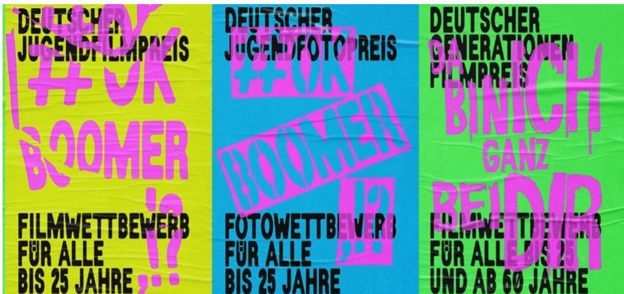
Banner: gemeinsame Jahresthemen Fotopreis und Filmwettbewerbe

Mit dem Jahresthema „#OK BOOMER,!?“ wurden im September 2023 sowohl der Deutsche Jugendfotopreis als auch der Deutsche Jugendfilmpreis zum gleichen Jahresthema ausgeschrieben. Im Wettbewerbsjahr 2024 werden die beiden Jugendwettbewerbe damit erstmals thematisch synchronisiert und die Potenziale eines medienübergreifenden Sonderthemas erprobt.