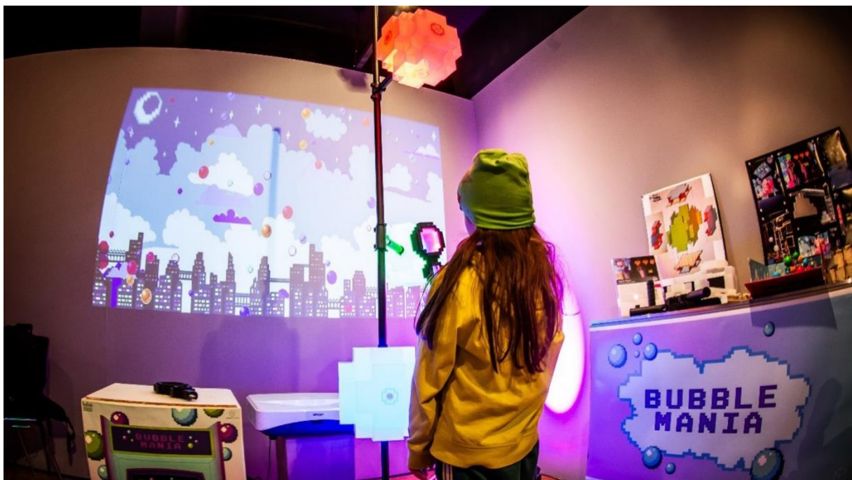
Auszeichnung für ‚Bubble Mania‘ (Studierende der Hochschule der Medien Stuttgart, Gruppenpreis)

„Die farbenfrohe Landschaft von Bubble Mania lädt zu einem Arcade-Erlebnis der Extraklasse ein. Hierbei handelt es sich um eine interaktive Installation, die es ermöglicht, als Gruppe gemeinsam in das Innenleben eines Videospieles einzutauchen. Angefangen mit einem Prototyp aus Pappe, haben die knapp 20 Studierenden die haptische Welt inklusive der Spielcontroller mithilfe eines 3D-Druckverfahrens selbst entwickelt. Diese wurde ergänzt durch eine digital gestaltete Umgebung, die bis ins kleinste Detail liebevoll ausgearbeitet wurde. Die insgesamt stimmige 8-Bit-Optik lässt nicht nur die Herzen der Jury, sondern sicherlich auch die eines jeden Retrofans höherschlagen. Jede erdenkliche mediale Disziplin erhielt bei Bubble Mania ihre gebührende Aufmerksamkeit. Produktion, Interaktion, Sound, Licht, Raum, Animation und Grafik – all das so gekonnt in einem Projekt zu vereinen, erfordert eine ausgezeichnete Koordination. Vor allem jedoch bedarf es eines multimedial aufgestellten und höchst motivierten Teams, weshalb Bubble Mania für uns ein verdienter Hauptpreis in der Sonderkategorie "Gruppenpreis" ist!"