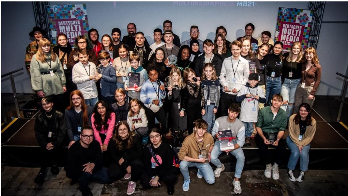
Preisträger*innen Deutscher Multimediapreis mb21 2023