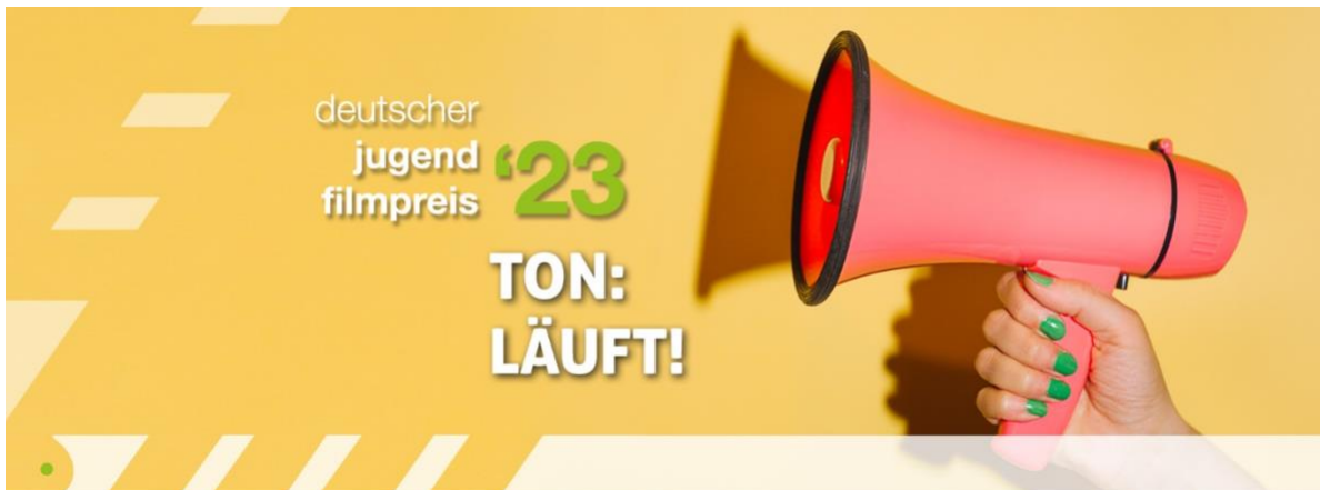
Deutscher Jugendfilmpreis, Visual zum Jahresthema 2023: TON: LÄUFT!

Soundtüftler*innen und Geräuschemacher*innen im Fokus. Egal ob Musikfilm, Band-Dokumentation, Musical, Stummfilm oder Musikvideo: Gefragt sind die Produktionen, die unseren Ohren mindestens genauso schmeicheln, wie unseren Augen. Zerreißt die Dialogbücher, stößelt eure Mikros ein oder zerrt eure Lieblingsband aus dem Proberaum vor die Kamera! Wie auch immer ihr den Sound ins Rampenlicht rücken wollt: Der Deutsche Jugendfilmpreis rollt euch schonmal den roten Teppich aus. Unsere Jury freut sich auf epische Klangkulissen und ein ausgiebiges Bad in meterhohen Schallwellen.