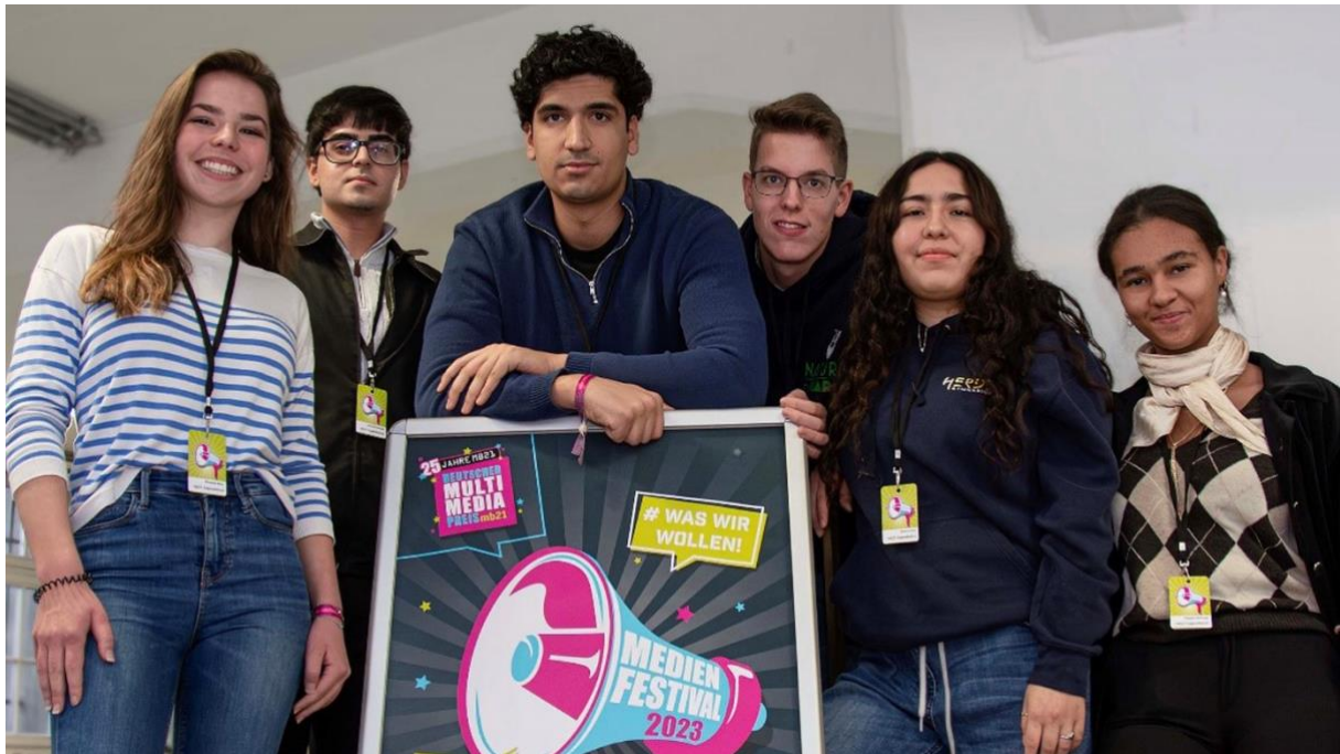
Jugendbeirat Deutscher Multimediapreis mb21

Räume für Beteiligung und Partizipation sollen im Wettbewerb auch zukünftig gewährleistet und nach Möglichkeit weiter ausgebaut werden.