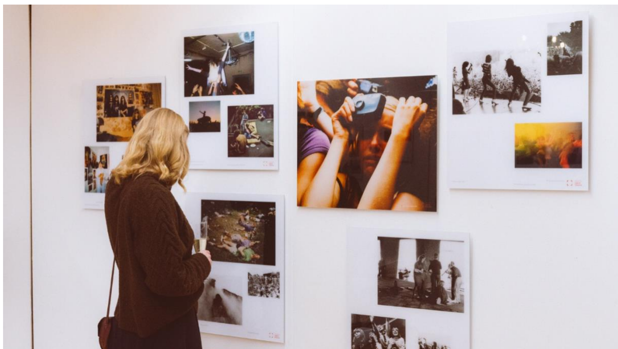
EMOP 2023 - Ausstellungswand in der Kulturmarkthalle Berlin