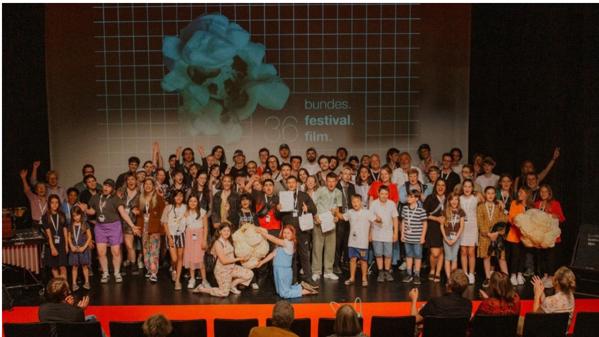
Preisträger*innen Deutscher Jugendfilmpreis und Generationenfilmpreis 2023

Die 40 für das Festival nominierten Filme aus dem Deutschen Jugendfilmpreis und dem Deutschen Generationenfilmpreis wurden von Freitagmittag bis Samstagabend in insgesamt sieben Filmblöcken dem interessierten Publikum präsentiert. Begleitet wurde jeder Film von einem kurzen moderierten Bühnengespräch mit den Filmemacher*innen, bei dem auch das Publikum seine Fragen einbringen konnte. Neben dem Filmprogramm lag der Fokus des Festivals aber vor allem auf Begegnung und Austausch der Filmschaffenden. Auf ein aufwändiges Rahmenprogramm wurde deshalb bewusst verzichtet. Stattdessen wurden zeitliche Freiräume geschaffen, in denen sich die Filmschaffenden zwischen den Filmblöcken bei bestem Wetter im angrenzenden Gastronomiegarten intensiv austauschen und vernetzen konnten. Das Radioprojekt „Junge Talente“ der Medienstelle Augsburg veranstaltete in einer Talk-Ecke Gesprächsrunden mit Filmemacher*innen und das Märchenzelt am Kulturhaus Abraxas bot die Möglichkeit eines phantasieanregenden Märchenspaziergangs.