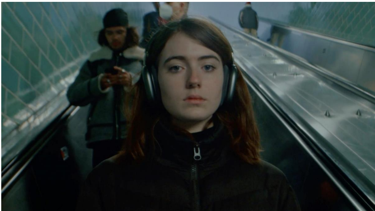
Filmstill ‚Bell Mal‘ (Janne Hansberg, Deutscher Jugendfilmpreis, Altersgruppe C)

In der Altersgruppe C (16 bis 20 Jahre) zeigt sich im Vergleich zu den beiden jüngeren Altersgruppen abermals ein deutlicher Sprung – nicht nur hinsichtlich der filmtechnischen und inszenatorischen Qualität, sondern auch mit Blick auf die gewählten Sujets und experimentierfreudigere Erzählweisen. In diesem Jahr war besonders auffällig, dass sich viele Filme auf abstrakte Weise mit Innenansichten und dem Gefühlsleben junger Menschen auseinandersetzten. Die Suche nach der eigenen Identität und das Erwachsenwerden sind dabei nach wie vor ein großes Thema. Aber auch gesellschaftliche Themen wie Geschlechtersensibilität, sexualisierte Gewalt und Mobbing werden ab dieser Altersgruppe deutlich vielschichtiger behandelt. Insgesamt wirken viele Produktionen cineastischer – so auch der Film „Bell Mal“ von Hauptpreisträger Janne Hansberg.