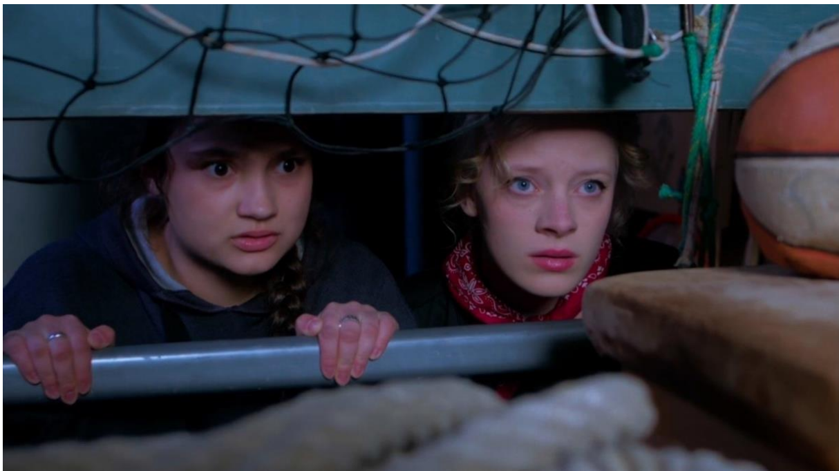
Filmstill „Die Schule brennt und wir wissen warum“ (Janina Lutter, Deutscher Jugendfilmpreis, Altersgruppe D)

Zwei Jugendliche treffen sich nachts in der Schule. Die eine, weil sie mit Collagen auf Mobbingfälle in der Schule aufmerksam machen möchte. Die andere, weil sie herausfinden will, wer hinter den Collagen steckt. In einem begrenzten Setting, über den Zeitraum nur einer Nacht und weitgehend nur mit zwei Personen hat Janina Lutter einen eindringlichen Film über ein brisantes Thema gedreht. In den besten Momenten gelingt es ihr, durch Fotos und einen nüchternen Voice Over-Kommentar unglaublich unangenehme Bilder im Kopf entstehen zu lassen und so die Grausamkeit von Mobbing spürbar zu machen. Die eigene Handschrift von Janina ist klar erkennbar in diesem herausragenden Film.