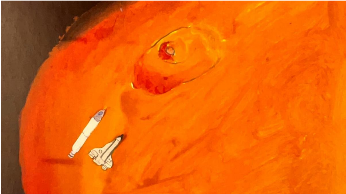
Filmstill ‚Flug zum Olympus‘ (Moviebande, Deutscher Jugendfilmpreis, Altersgruppe A)