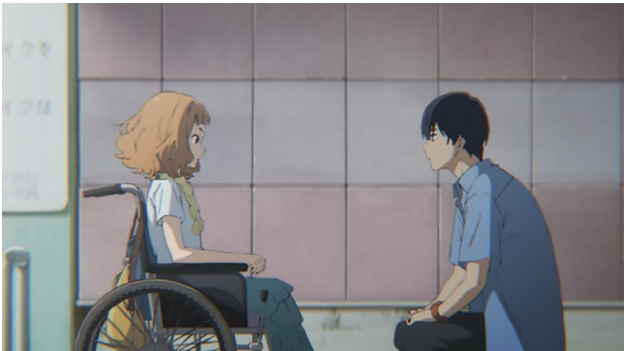
Filmstill ‚Josie der Tiger und die Fische‘

Wenn über Diversität gesprochen wird, dann geht es immer auch darum, welche Personengruppen gesellschaftlich teilhaben können, wahrgenommen, gesehen und gehört werden – und welche Personengruppen diesen Raum nicht oder nur unzureichend bekommen. Vor diesem Hintergrund wurde in der sechsten Ausgabe des Dossiers beleuchtet, wie es um die Inklusion im Kinder- und Jugendfilm steht. Welche Rolle spielen Menschen mit Behinderungen in Kinder- und Jugendfilmen heute? Wie hat sich die Darstellung von Menschen mit Behinderungen dabei im Laufe der Zeit verändert? Mit welcher Haltung erzählen die Filme und welche Themenschwerpunkte setzen sie? Zu lange waren Menschen mit Behinderungen nur „supporting actor“ und spiegelten als solche die ethischen Ambitionen der eigentlichen Protagonist*innen. Behinderte Menschen bekamen selten Zugang zu Produktionen und wurden stattdessen von nicht-behinderten Schauspieler*innen verkörpert. Doch die Akzente verschieben sich und es gibt ermutigende Entwicklungen, denen sich das Dossier „Filme mit inklusiven Perspektiven“ widmet.