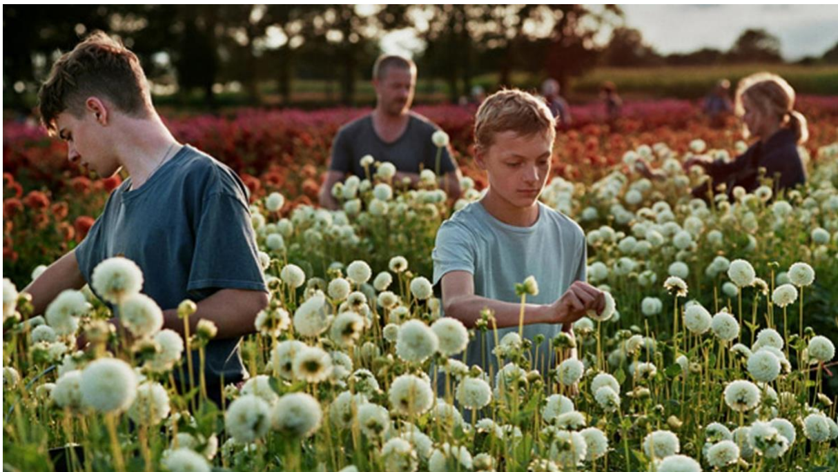
Filmstill ‚Close‘

So bildet das Editorial einen Ausgangspunkt, der inhaltliche Schwerpunkte ins Zentrum stellt und Lust auf thematisch anknüpfende Veröffentlichungen macht. Im Rahmen des Formats „Neustarts“ wird regelmäßig eine redaktionelle Auswahl von spannenden Kinder- und Jugendfilmen veröffentlicht, die aktuell im Kino und als Streaming-Angebot erscheinen. Persönliche Eindrücke zu Kinder- und Jugendfilmfestivals und den mit diesen verbundenen Filmen und Veranstaltungen finden Nutzer*innen unter „Festivals“. Beobachtungen zu filmästhetischen, filmpädagogischen oder filmwirtschaftlichen Themen, die an aktuelle und zurückliegende Veröffentlichungen andocken, kommen in der Kategorie „Hintergrund“ zum Tragen, wichtige Akteur*innen (Filmschaffende, Schauspieler*innen etc.) in der Kategorie „Interviews“ zu Wort. Einen differenzierten, augenzwinkernden Blick auf formale und inhaltliche Klischees und Stereotype im Kinder- und Jugendfilm wirft das Format „Den kenn' ich doch“. Einprägsame Szenen und Figuren stehen in „Magische Momente“ und „Junge Held*innen“ im Mittelpunkt. Mit „Was ist ein Kinderfilm?“ bzw. „Was ist ein Jugendfilm?“ treten zudem Formate hinzu, die reflektieren, was Kinderfilm oder Jugendfilm im engeren oder weiteren Sinne eigentlich ausmacht.