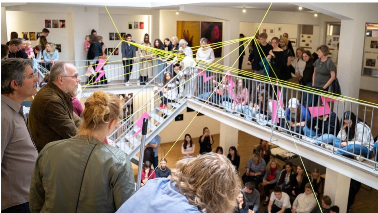
Next! Festival 2023 in Köln

Im Rahmen des Kölner NEXT! Festivals für junge Fotografie im Mai 2023, kooperierte der Deutsche Jugendfotopreis mit der jungen Sparte des ukrainischen Festivals für Fotografie, Odesa Photo Days.