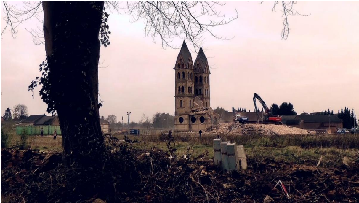
Filmstill ‚Immerath – ein Dorf muss weg‘ (Werner Handl, Deutscher Generationenfilmpreis, Kategorie „60plus“)

So erfreulich es ist, dass die Anzahl der insgesamt eingereichten Filme im Vergleich zum Vorjahr zugenommen hatte, stellte die Jury bei der Sichtung aber doch fest, dass die Filmeinreichungen in der Kategorie „60plus“ nach der Pandemie noch nicht zu ihrer früheren qualitativen Stärke zurückgefunden haben. Im Allgemeinen scheinen die teilnehmenden Filmschaffenden der älteren Generation dem Visuellen wenig zuzutrauen und wählten lieber etablierte Erzählweisen, statt mit filmsprachlichen Mitteln zu experimentieren. Auffallend war im Wettbewerbsjahrgang 2023 die Vielzahl der dokumentarischen Arbeiten der älteren Filmschaffenden, denen lediglich eine fiktive Spielfilmproduktion sowie ein Animationsfilm entgegenstanden. Auch der Anteil an weiblichen Filmemacherinnen ist in der Alterskategorie leider weiterhin auf niedrigem Niveau. Dennoch sind die Filme, die in die engste Auswahl kamen, von hoher filmischer und erzählerischer Qualität und vermitteln mit ihrem thematischen und ästhetischen Spektrum das grundlegende Potenzial des Deutschen Generationenfilmpreises , aktuelle gesellschaftspolitische Belange aus der Perspektive älterer Menschen darzustellen. Exemplarisch hierfür steht der dokumentarische Film „Immerath – Ein Dorf muss weg“ von Werner Handl (78 Jahre), der den Hauptpreis in der Kategorie „60plus“ erhielt.