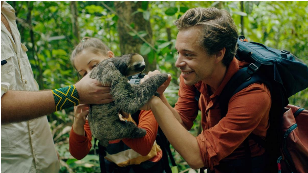
Filmstill ‚Checker Tobi und die Reise zu den fliegenden Flüssen‘

Auf dem Titelbild prangt im Bericht der FFA „Die drei Fragezeichen – Das Erbe des Drachen“. Ein Kinderfilm auf dem Titel, das ist ein Statement! Und so geht es im Wirtschaftsbericht der FFA Seite für Seite weiter. Unter den Top-Ten der erfolgreichsten Titel sind drei Kinderfilme gelistet. Weitere Kinderfilme wie „Checker Tobi und die Reise zu den magischen Flüssen“, „Das fliegende Klassenzimmer“, „Die Schule der magischen Tiere 2“, „Der Räuber Hotzenplotz“ oder „Lassie – ein neues Abenteuer“, zählen zu den quotenmäßigen Erfolgstiteln des zurückliegenden Jahres. In der Sparte Jugendfilm war „Sonne und Beton“, ein Werk mit viel Berlin-Flair von Anfang der 2000er Jahre, ein Ereignis. Und mit dem Film „Wochenendrebellen“ stand auch eine besondere Fußballfan-Geschichte ganz hoch in der Gunst des Publikums, die als ein Stück bester Familien-Unterhaltung alle Generationen gleichermaßen anspricht.