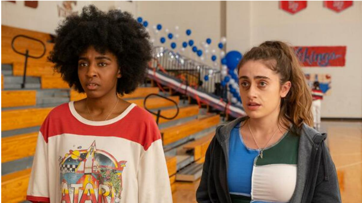
Filmstill ‚Bottoms‘

ebenso problematische Denk- und Wahrnehmungsmuster an. Titel, die qualitativ besonders hervorstechen, werden noch einmal separat in der Rubrik „Tops“ aufgeführt. Bei Möglichkeit werden die Kritiken um Themenausgaben (Rubrik „Themen“) und Blogbeiträge („Blog“) ergänzt, um zu einer vertiefenden Auseinandersetzung mit meinungs- und persönlichkeitsbildenden Themen anzuregen.